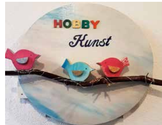
Die Hobbykunstgruppe veranstaltet regelmäßige Ausstellungen in Rheindorf...

Auch das bestehende kirchenmusikalische Angebot soll das Gemeindeleben in gewohnter Form bereichern. Die verschiedenen Musikgruppen, die Band „Living Hope“, der Kirchenchor der Hoffnungskirche, der Chor „Living Echoes“ und das Blockflötenensemble „Flautiamo“ sollen fortbestehen und zukünftig in beiden