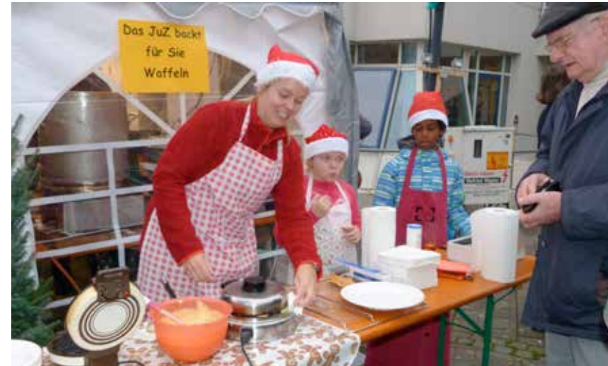
Voller Einsatz beim Advents- markt an der Petruskirche: