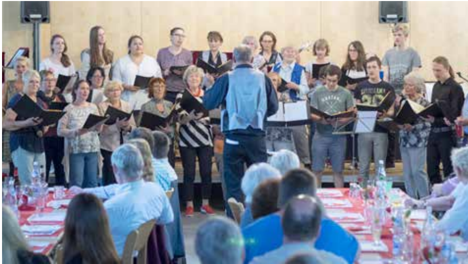
Beim Abend der Begegnung in Rheindorf trägt der Projektchor ehrenamtlich zum Gelingen bei...